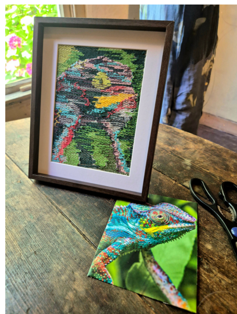
Kameleon geweven met Moorman-techniek

Bij wigweven leg je de draden niet kruislings tussen de kettingdraden, maar in een schuine hoek. Omdat de ketting heel strak gespannen staat ga je die kettingdraden manipuleren. Als je je werk vervolgens van het getouw haalt, dan krijg je bochtjes. Het is weer eens wat anders. Je wilt je creatieve brein kwijt in die draadjes.