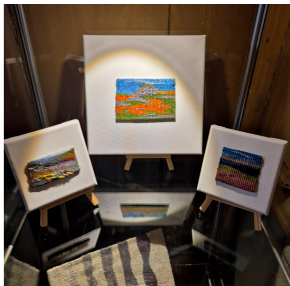
Landschappen geweven met naaigaren door Selma Sindram