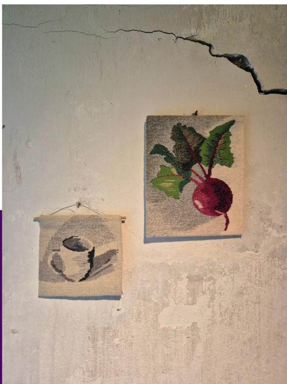
Koffiekopje en radijs

Ik kijk de uitleg online, vervolgens probeer ik het zelf uit en maak ik een lesbrief waar onze wevers aan de slag mee kunnen gaan. YouTube is fantastisch, voor oude mensen en voor jongeren!